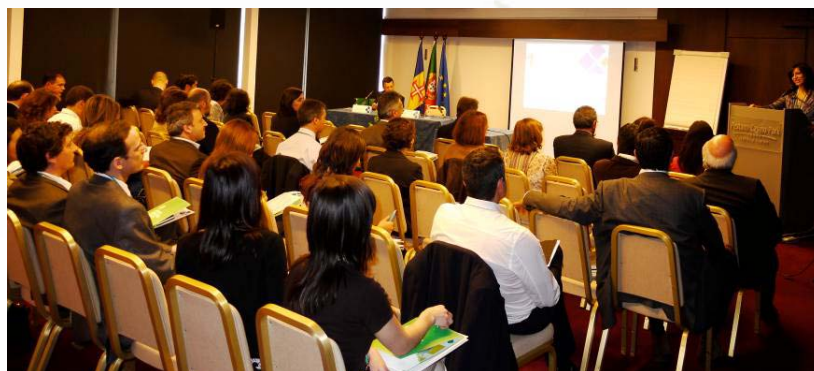
Vista Geral do Encontro

Aos patrocinadores do evento – IAPMEI e BES – que acreditaram na necessidade da realização de um evento para discussão da temática da qualidade do empreendedorismo e da inovação bem como na potencialidade da rede BICs em Portugal o nosso muito obrigado!