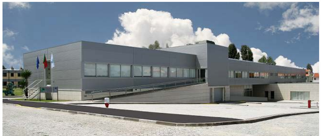
Edifício PROMONET Incubadora de 3ª geração

Ainda em 2008 com a presença de Sua Excelência o Senhor Presidente da República, Professor Doutor Aníbal Cavaco Silva, inaugurou o Edifício PROMONET, incubadora de 3ª geração.