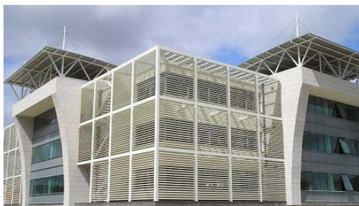
AIBAP / BIC – Beira Atlântico