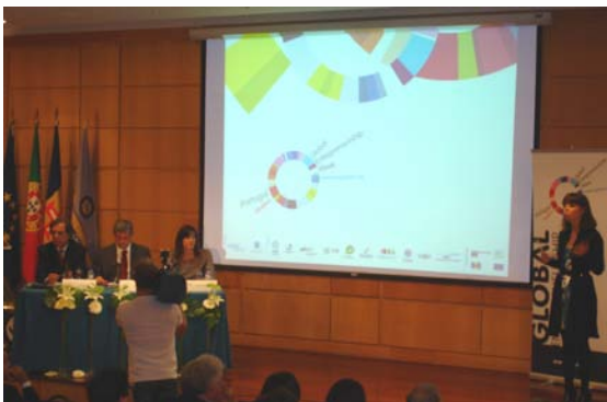
Sessão de Abertura da Global Entrepreneurship Week 2009 na Madeira

http://www.ceim.pt/index.php?option=com_content&task=view&id=442&Itemid=318