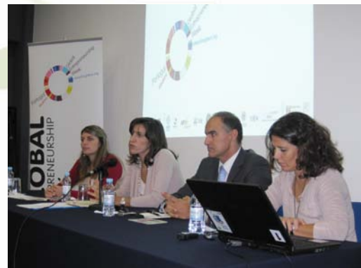
Actividade desenvolvida durante a GEW 2009 na Madeira