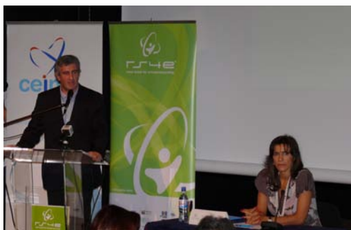
rs4e – road show for entrepreneurship